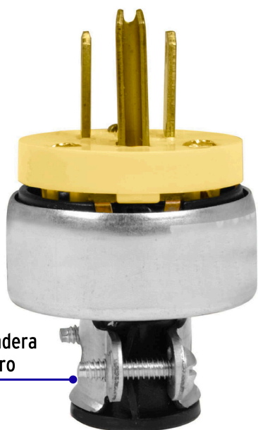
Abrazadera de acero