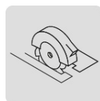
Para sierra circular