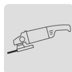
Para esmeriladora angular