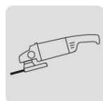
Para esmeriladora angular